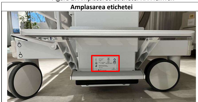
Figura 2. Amplasarea etichetei HA FlexTrak

Eticheta de identificare HA FlexTrak este poziționată pe mânerul căruciorului, sub pedala pompei, așa cum este ilustrat în Figura 2.